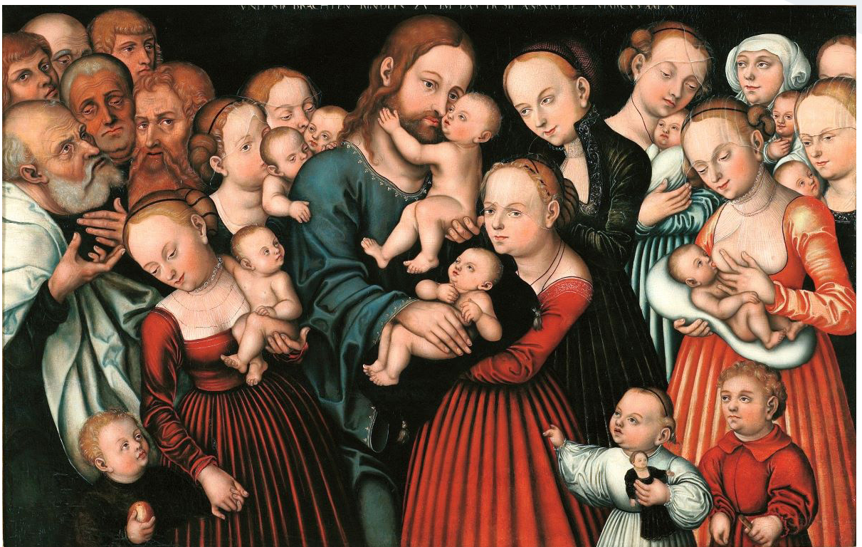
Schilderij van Cranach bij de preek van zondag 22-9-2024